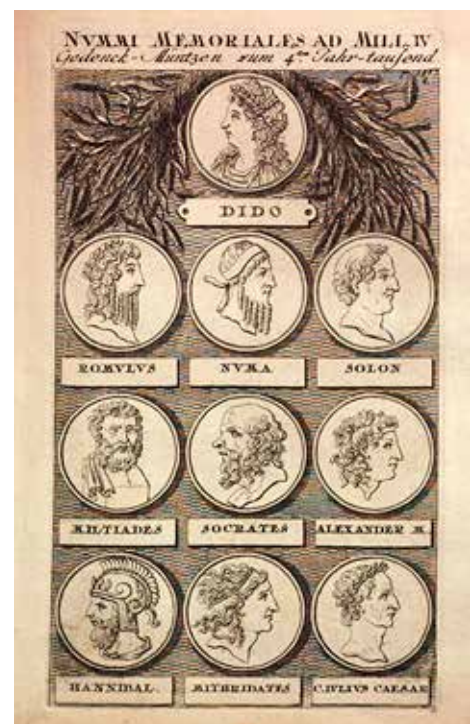
Abb. 2 Kupfertafel mit Gedenkmünzen zum vierten Jahrtausend seit Erschaffung der Welt

Die Medaillonform der Bildpräsentation führt ebenso zu einem Säkularisierungsschub und zu einer Wissensvermittlung in den Kontext der Histoire métallique . Hier geht es um die Vergegenständlichung des Wissens durch eine imaginierte Materialität: Wissen wird als Modell präsentiert. Gezeigt werden Schaustücke des Wissens als Medaillen mit Wissenskernen. Dies wird konkret auch in der Welt in einer Nuß praktiziert, indem als Merkmal dieses Säkularisierungs- und Materialisierungsprozess auch vier Tafeln der Kupferstichsuite mit Schau-münzen abgebildet werden, die Porträts von viris illustris der Historia mundi in Medaillenform darstellen, die wegen ihrer historischen Bedeutung merkwürdig sind. Diese Münztafeln wurden erstmals in der Ausgabe von 1722 in das Kupferwerk aufgenommen: Sie zeigen »Portraits berühmter Persönlich-