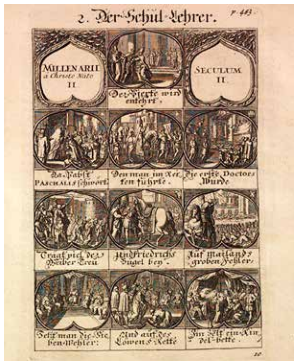
Abb. 1 Mnemotechnische Kupfertafel von Christoph Weigel mit den zehn merkwürdigsten Denkwürdigkeiten der Historia mundi des 12. Jahrhunderts. – Jedes Bildfeld zeigt ein Hauptereignis eines Jahrzehnts. Die Jahreszahl kann über die Figur in der rechten oberen Ecke zugeordnet werden. Merkverse erleichtern die Orientierung. Winterpflanzen in den äußeren oberen Bildfeldern kennzeichnen das zweite Jahrtausend; die zwei Ecken der Rahmung der Bildfelder das zweite Jahrhundert.

Zentraler Kern der Wissensvermittlung des Bilderbuchs waren die 48 Kupfertafeln, 17 auf denen die Wissenskerne der historischen Hauptereignisse aus der Universalgeschichte in Aufrissdarstellungen in Miniaturformat und in Medaillonform veranschaulicht worden sind. Zu jedem Jahrtausend gibt es Jahrhunderttafeln, auf denen ein geordneter Vorrat von historischen Hauptereignissen zu sehen ist – entweder zehn Bilder für zehn Ereignisse aus zehn Jahrhunderten auf einer Jahrtausendtafel oder zehn Bilder für zehn Ereignisse für zehn Jahrzehnte auf einer Jahrhunderttafel (vgl. zum Folgenden den Vorbericht in Köhler/Weigel 1726). Die Jahrtausende werden mit floralen Schmuckelementen mnemonisch symbolisiert, die Bezüge zur Erschaffung der Welt erkennen lassen: Weil Gott die Welt im Herbst erschuf, ist das erste Jahrtausend mit Herbstblumen, das zweite mit Winterblumen, das dritte mit Frühlingsblumen ausgeschmückt, die zugleich der Zier der Kupfertafeln und damit zum ansprechenden ästhetischen Arrangement der Bildebene der Wissensvermittlung dienen.